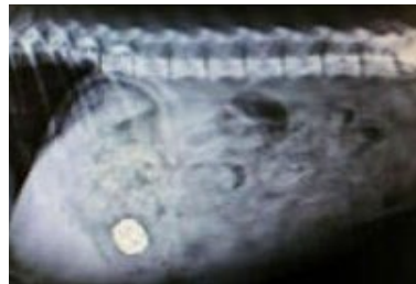
肚子裡有一個鈴鐺