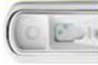
四合一檢驗試劑呈 現心絲蟲陽性

心絲蟲主要寄生在狗狗的右心室和肺動脈，成蟲長得像米粉，長約20公分。當蚊蟲叮咬了患有心絲蟲狗狗的血，血液中的幼蟲就有可能經由蚊蟲的下一代叮咬再傳染給另一隻狗狗。