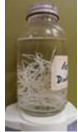
肉眼可見，長得 像米粉的蟲體