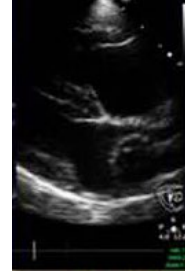
四合一檢驗試劑呈 現心絲蟲陽性 超音波下可見心絲 蟲寄生於肺動脈