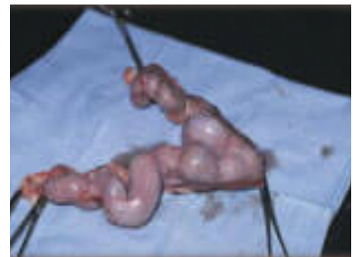
外科手術取下膨大的子宮卵巢